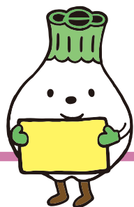
ウポポイPRキャラクター トゥレップン