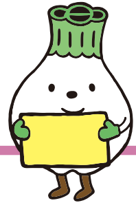
ウポポイPRキャラクター トゥレップン